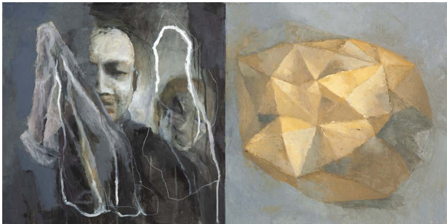
Série Guerre / D'une face, l'Autre - 2019 - huile sur toile - 50 x 100 cm.

« Dans la série « guerre », dans un premier temps, la figuration s'est imposée et la toile a été un terrain de combat où les figures humaines offraient leur deuil et leur souffrance, puis peu à peu les couches se sont superposées, ont traversé une sonorité chaotique jusqu'au « presque-monochrome » qui s'est déposé sur la toile tel une paix immobile et silencieuse... »