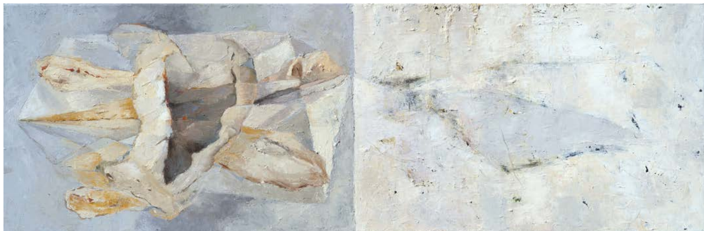
Série Blanche : Entre la forme et sa défaite – 40 x 120 cm – 2018 huile sur toile

C'est peut-être cela que me permet la peinture, à refaire ces pas à chaque fois, du connu vers l'inconnu. »