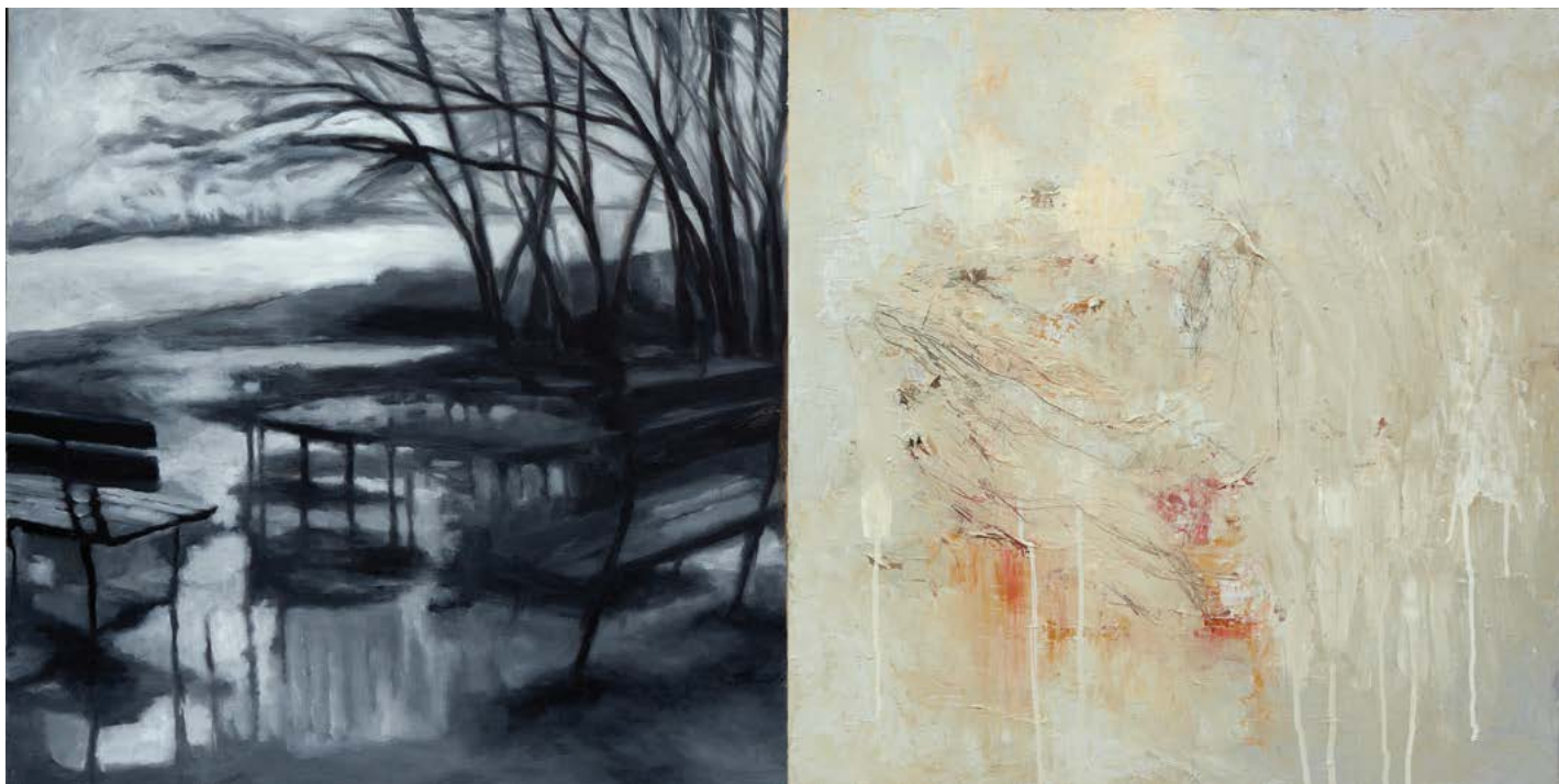
Série Les Flottants / Double page, Noyade – huile sur toile - 2019 – 50cm x 100cm