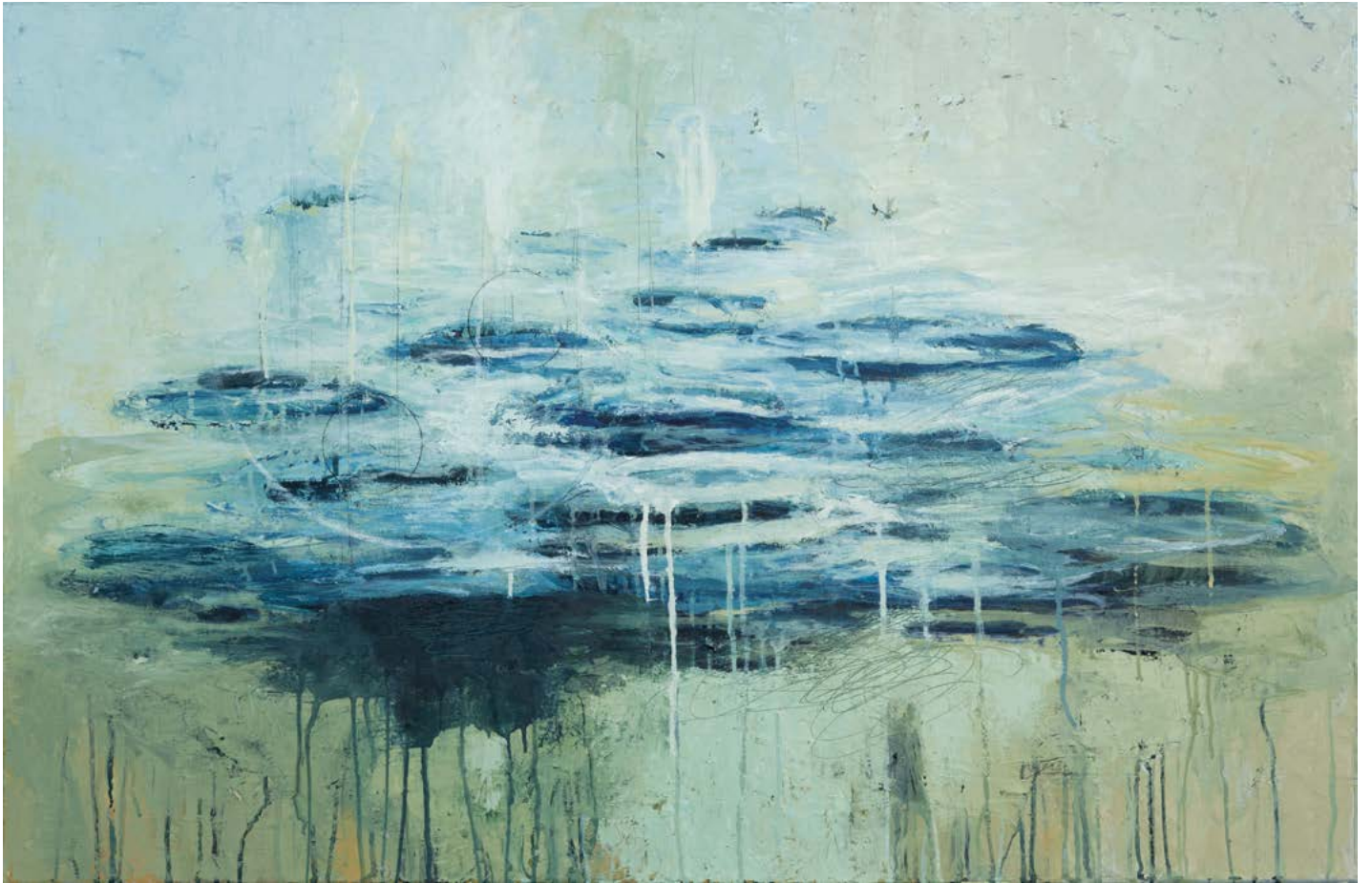
Bleu comme aucun fruit – 65 x 100 cm – 2019 - huile sur toile