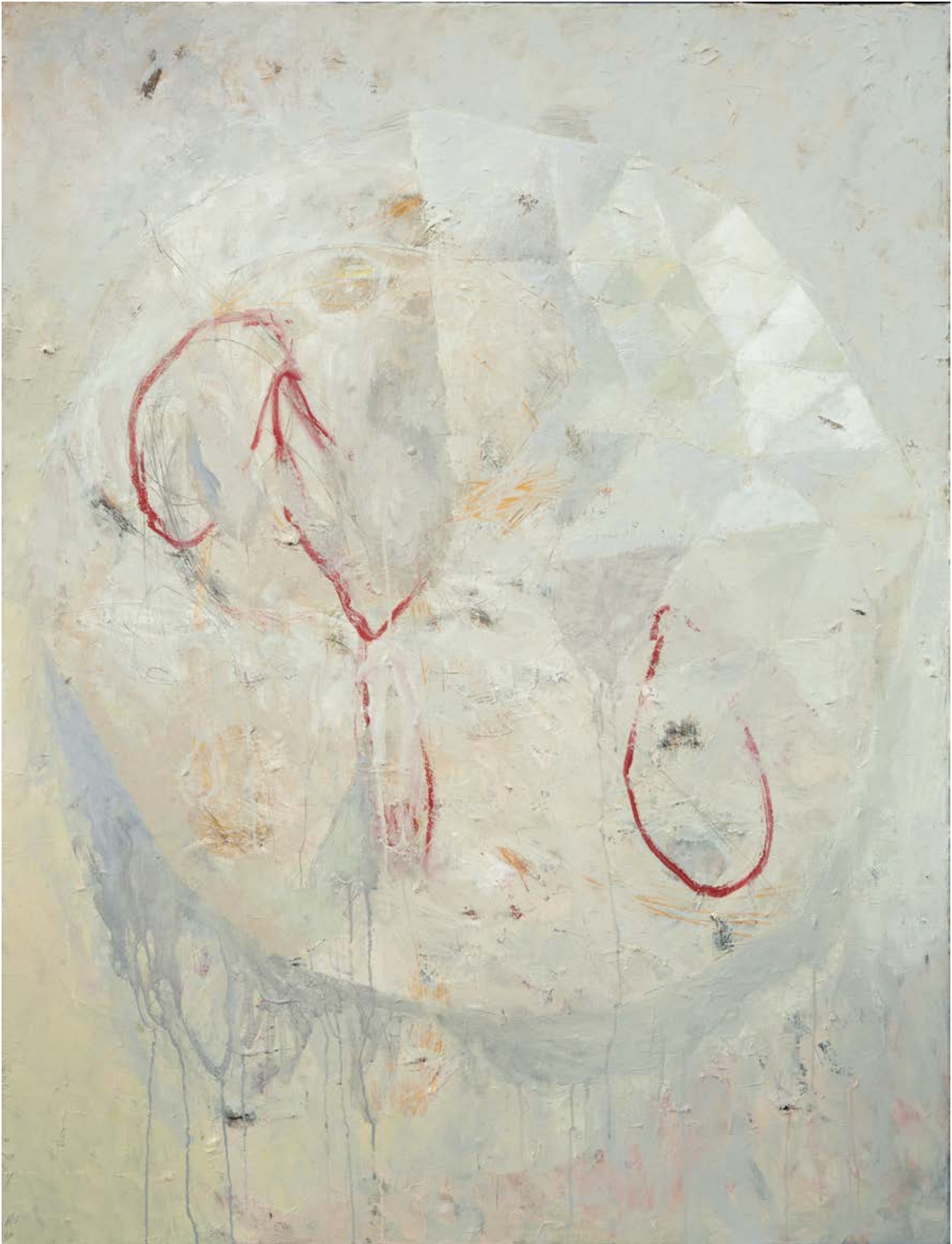
Série Guerre / Autant en importe le monde 2 / huile sur toile, 116cm x 89cm - 2019