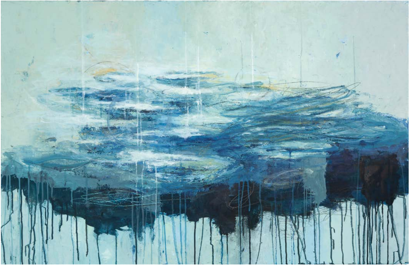
Quand le ciel tombe à l'eau – 65 x 100 cm – 2019 - huile sur toile