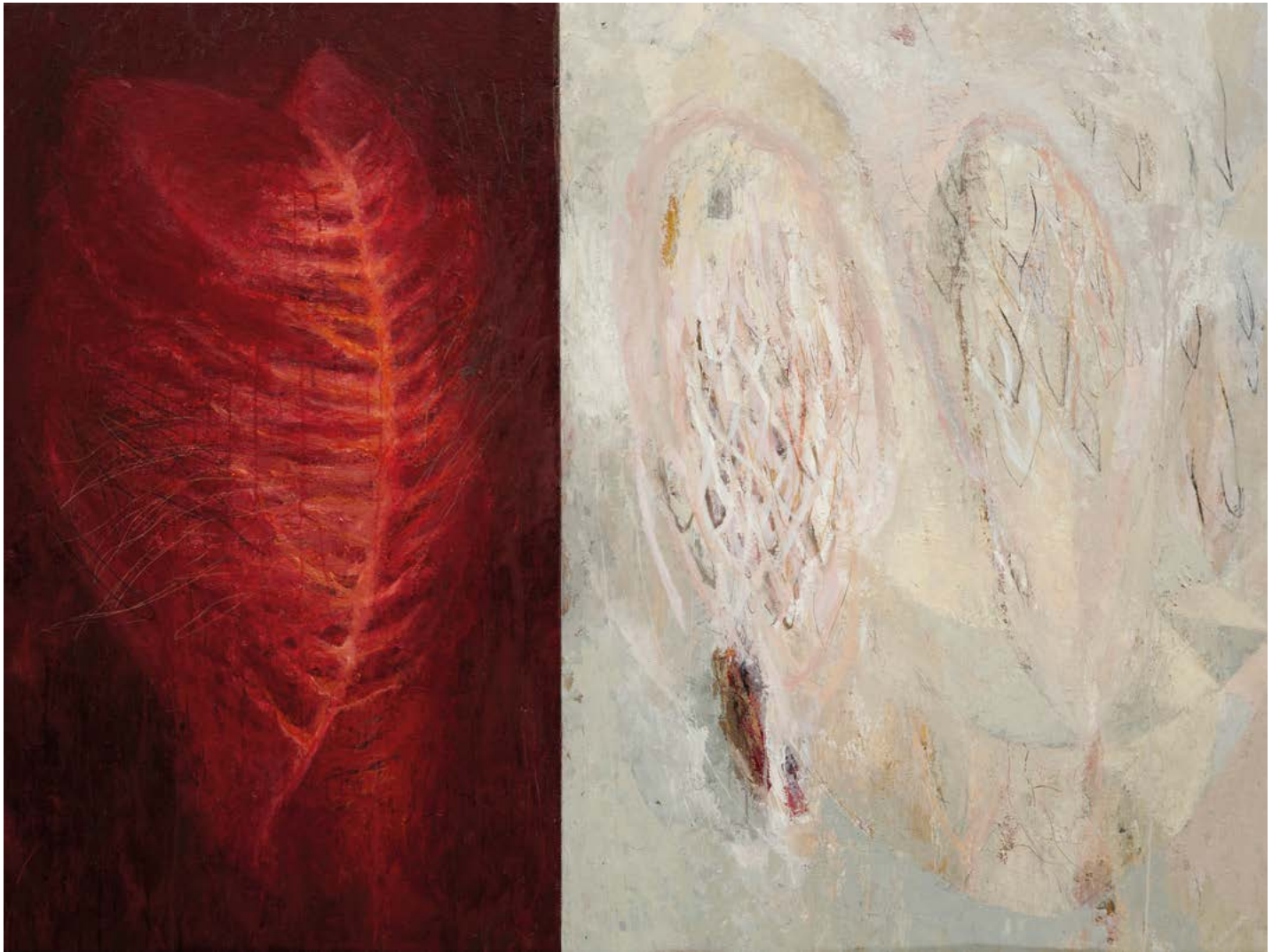
Série Guerre / De chair et de plume / huile sur toile, 97cm x 130cm - 2019