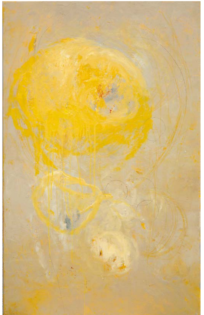
Tremblement huile sur toile, 100cm x 65cm - 2019