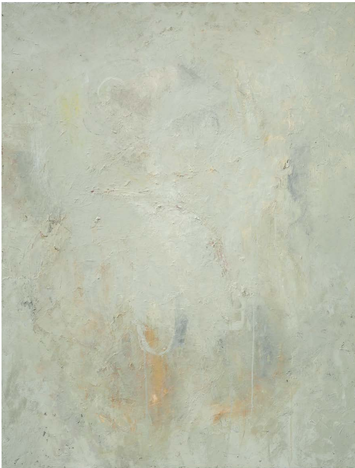
Série Guerre / Autant en importe le monde 1 - huile sur toile, 116cm x 89cm - 2019