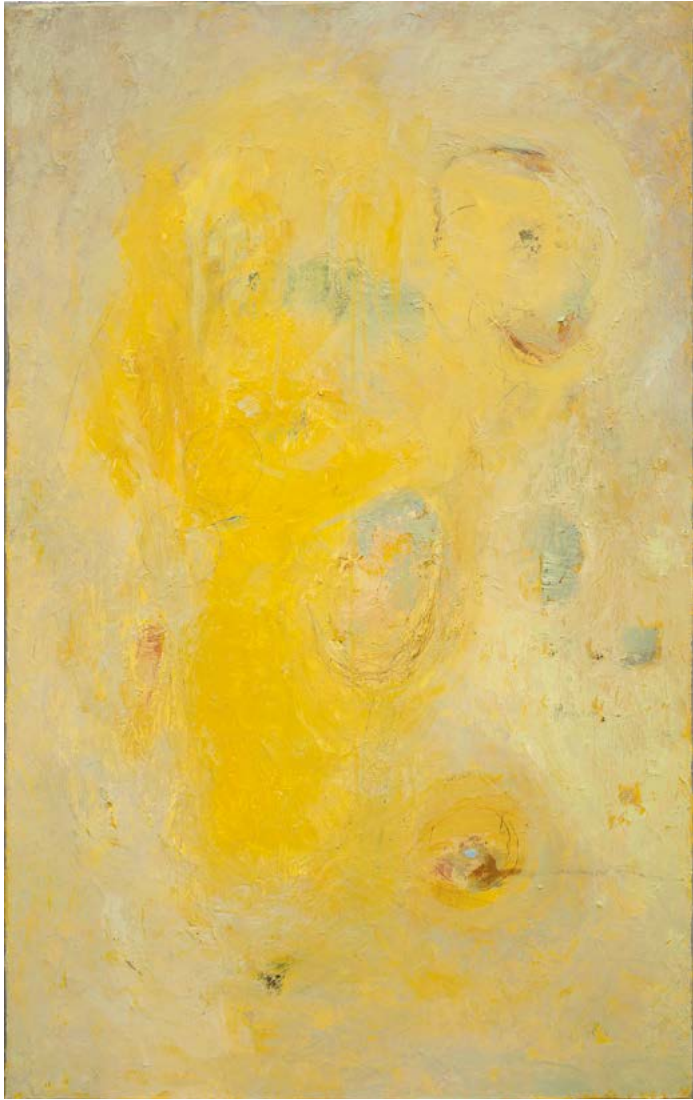
Patience du ciel huile sur toile, 100cm x 65cm - 2019