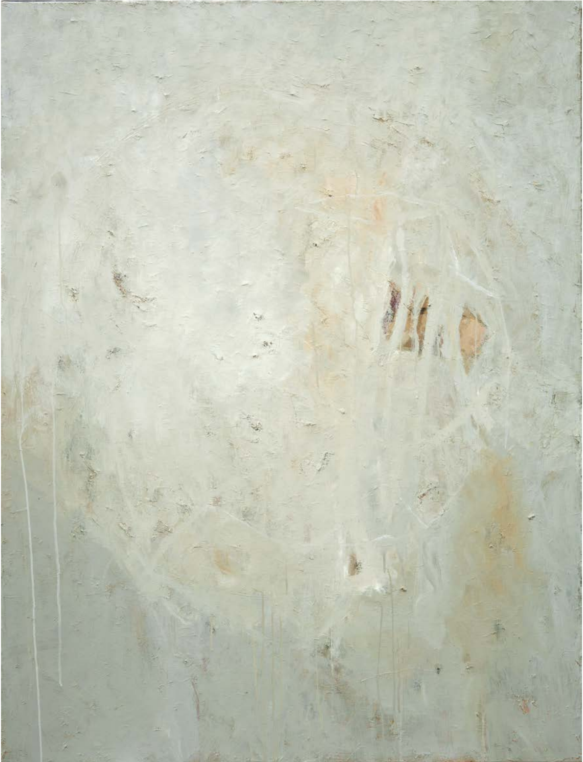
Série Guerre / Autant en importe le monde 3 / huile sur toile, 116cm x 89cm - 2019