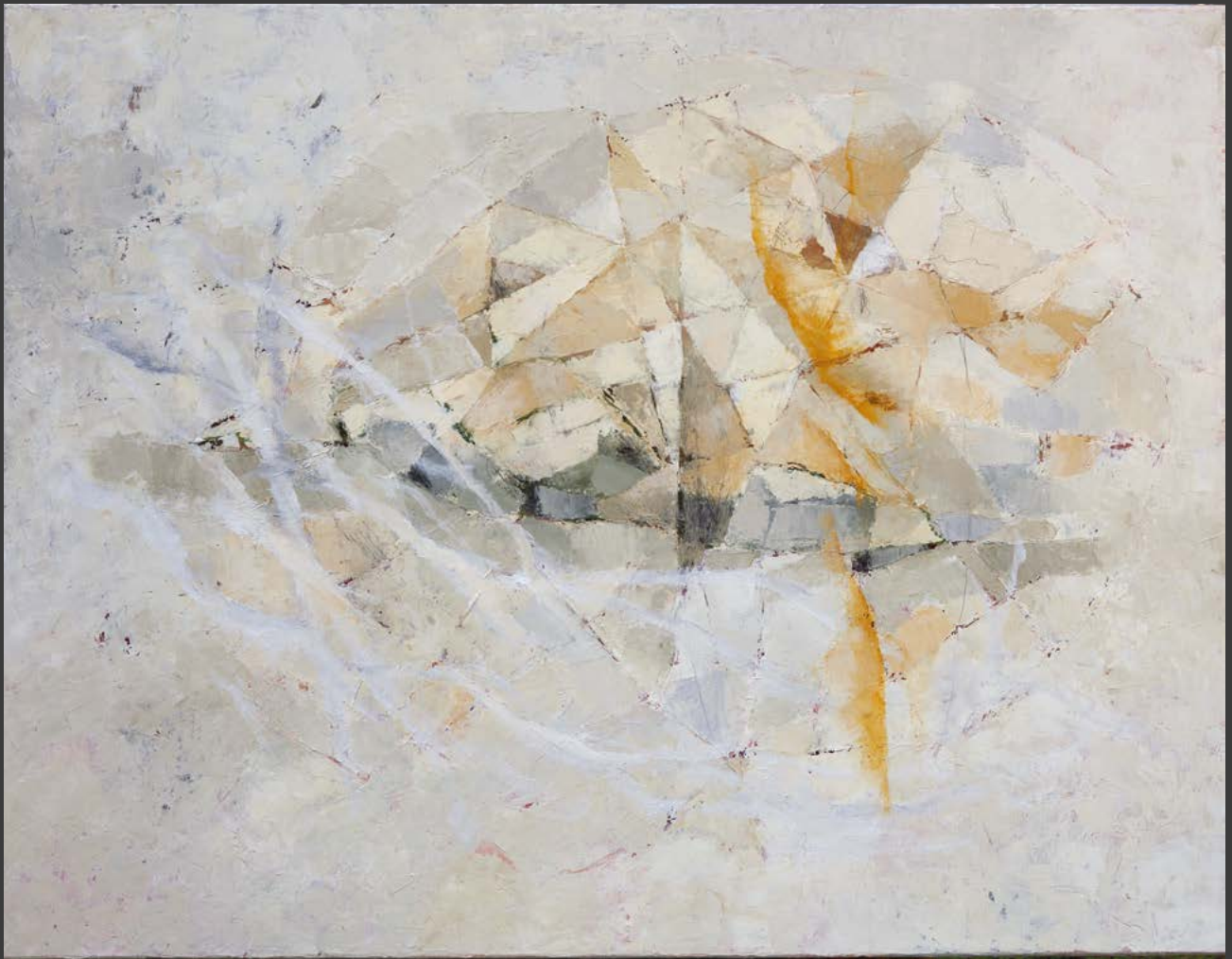
Série Blanche / Dans le diamant tu m'effaces / huile sur toile, 100cm x 81cm - 2018