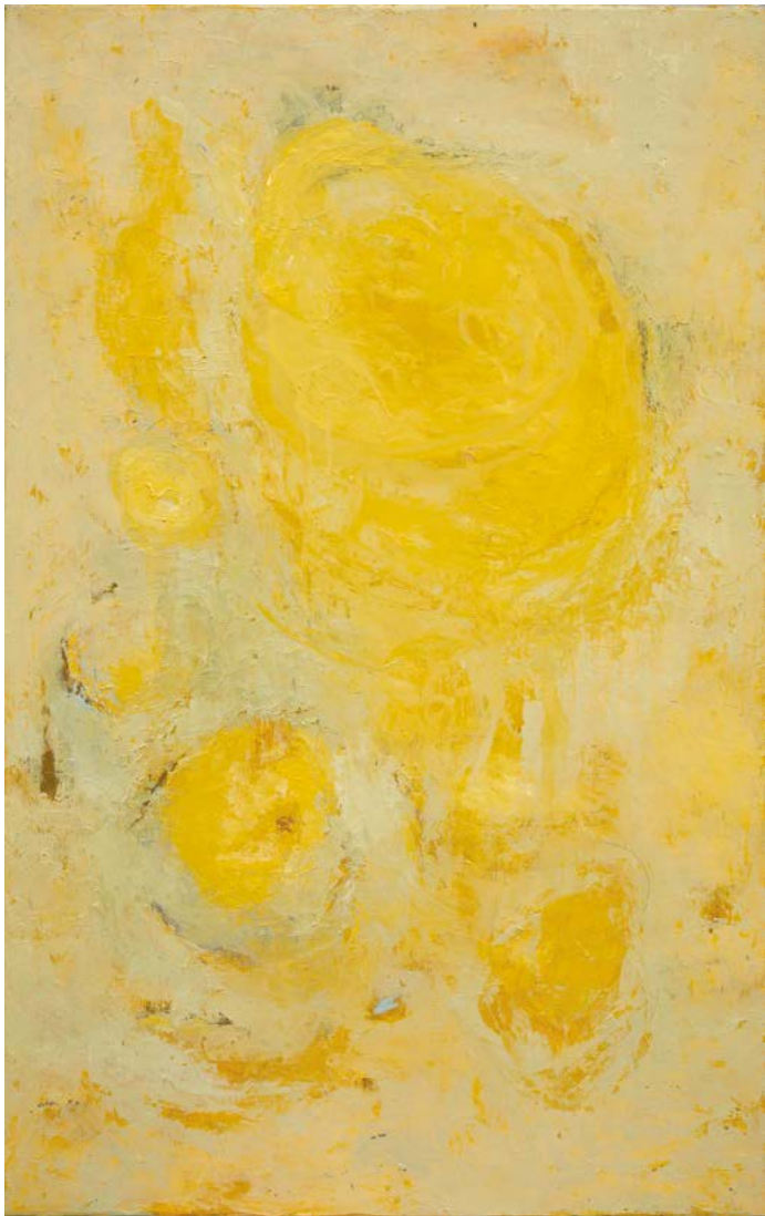
Son Jaune huile sur toile, 100cm x 65cm - 2019