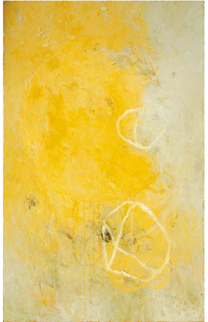
Accord huile sur toile, 100cm x 65cm - 2019